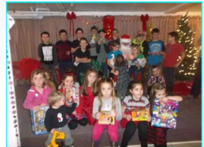
Des jeunes heureux!