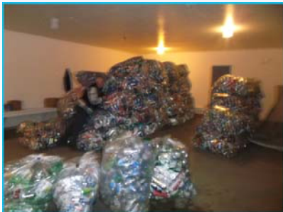
Des tonnes de cannettes!