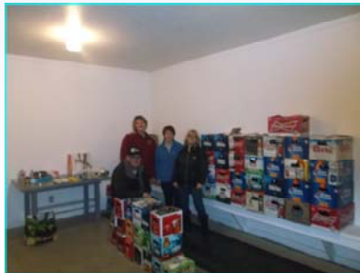
Des tonnes de bouteilles!