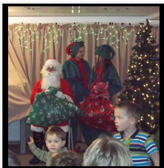
LA FÊTE DE NOËL DU 14 DÉCEMBRE 2013