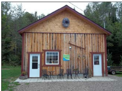
L'accueillante fromagerie du 105, Chemin du 3 e Rang Sud